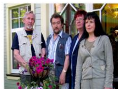
Puheenjohtajia vuosien varrelta