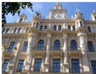
Riikassa riittää katsottavaa

Riikan lisäksi kävimme myös Jurmalassa kokemassa kunnon sadekuuron ja yhteisen lounashetken.