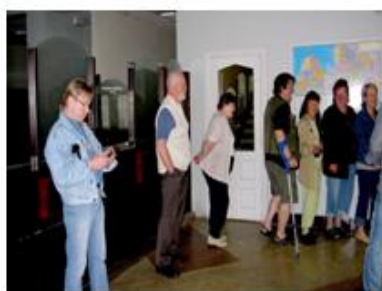
Viron ja Latvian rajalla vaihdettiin valuuttaa