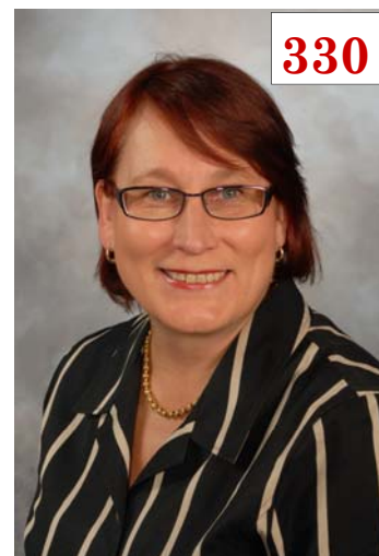
Myller Riitta Euroopan Parlamentin jäsen