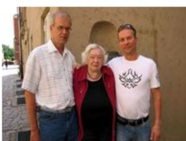
Rahakirstun vartioita, entisiä ja nykyinen.